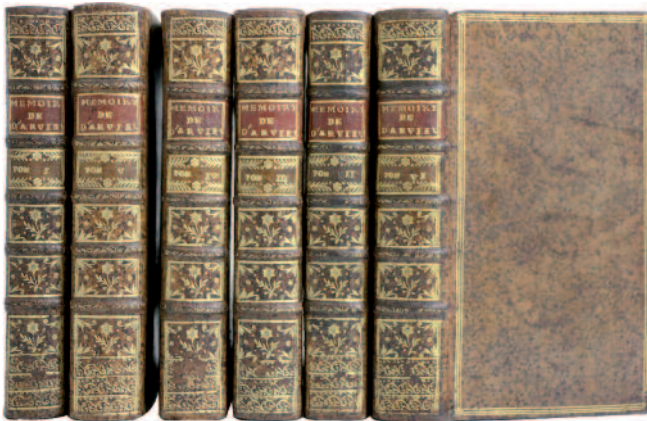
44. LABAT (Jean-Baptiste). MÉMOIRES DU CHEVALIER D'ARVIEUX, envoyé extraordinaire du Roy à la Porte, Consul d'Alep, d'Alger, de Tripoli, & autres échelles du Levant. Contenant : Ses voyages à Constantinople, dans l'Asie, la Syrie, la Palestine, l'Égypte, & la Barbarie, la description de ces Pais, les Religions, les mœurs, les Coutumes, le Négoce de ces Peuples, & leurs Gouvernemens, l'Histoire naturelle & les événements les plus considérables, recueillis de ses Mémoires originaux, & mis en ordre avec des réflexions. Paris, Jean-Baptiste Deslepine le fils, 1735 ; 6 vol. in-12, première édition