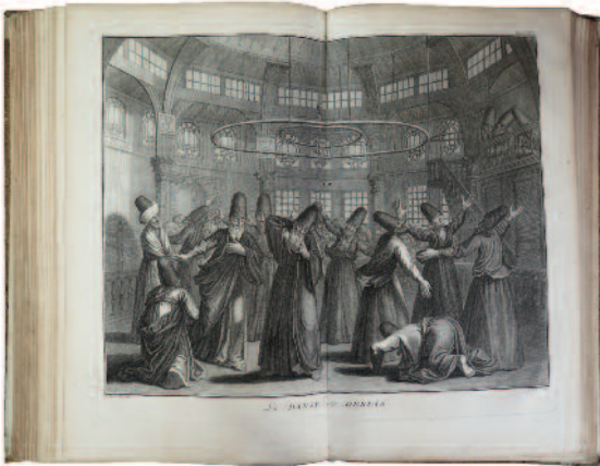
69. PICART (Bernard). CÉRÉMONIES ET COUTUMES RELIGIEUSES DETOUS LES PEUPLES DU MONDE [...]. Amsterdam, Paris, Laporte, 1783 ; 4 vol. pet. in-folio