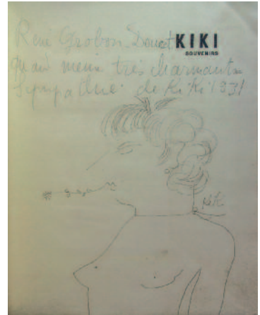
306. KIKI DE MONTPARNASSE. KIKI SOUVENIRS. Les Souvenirs de Kiki, préface de Foujita, ... Paris, Henri Broca, 1929 ; pet. in-4, édition originale d'un dessin et d'un envoi autographe