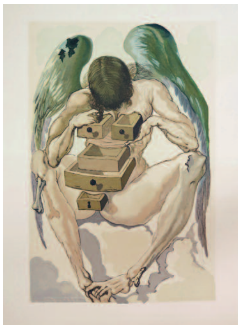
239. [DALÍ].— DANTE. LA DIVINE COMÉDIE. Paris, les Heures claires, 1963 ; 6 vol. in-4