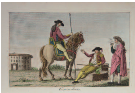
205. BRETON DE LA MARTINIÈRE (J.-B.) L'ESPAGNE ET LE PORTUGAL, ou mœurs, usages et costumes des habitans de ces royaumes, précédé d'un précis historique. Ouvrage orné de cinquante-quatre planches représentant douze vues et plus de soixante costumes différens, la plupart d'après des dessins exécutés en 1809 et 1810. Paris, A. Neveu, 1815 ; 6 vol. in-18