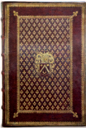
54. [MOLÉ]. LES ORDONNANCES ROYALES SUR LE FAIT ET JURISDICTION DE LA PREVOISIE DES MARCHANDS, & eschevinage de la ville de Paris. Paris, P.Rocolet, 1644 (photo de couverture)