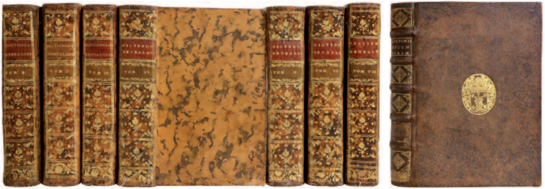
4. [AUBERT DE LA CHESNAYE DES BOIS (François-Alexandre)]. DICTIONNAIRE GÉNÉALOGIQUE, HÉRALDIQUE, CHRONOLOGIQUE ET HISTORIQUE, CONTENANT L'ORIGINE ET L'ÉTAT ACTUEL DES PREMIÈRES MAISONS DE FRANCE [...] de l'Europe. Paris, Duchesne, 1757-1765 ; 7 vol. in-8