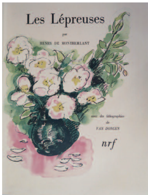
425. [VAN DONGEN].- MONTERLANT (Henry de). LES LÉPREUSES, AVEC DES LITHOGRAPHIES DE VAN DONGEN. Paris, N.R.F., 1946 ; in-folio, reliure mosaïquée